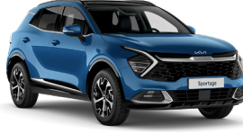
Gökyüzü Mavi (B3L)