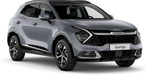
Aytaşı Gri (CSS)