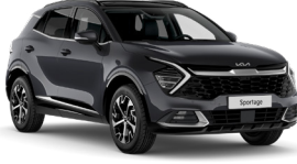
Fırtına Gri (H8G)