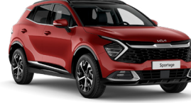
Manyetik Kırmızı (AA9)