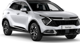
İnci Beyaz (HW2)