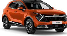
Fusion Turuncu (RNG)