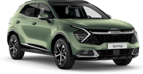
Experience Yeşil (EXG)