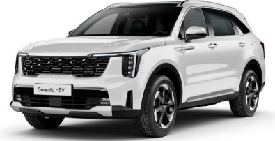
İnci Beyaz (SWP)