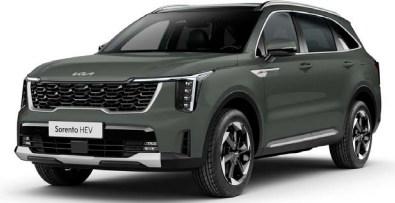
Cityscape Yeşil (CGE)