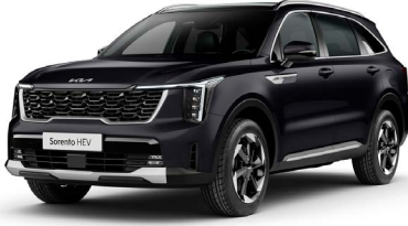
İnci Siyah (ABP)