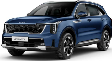
Mineral Mavi (M4B)