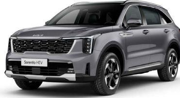
Metal Gri (KLG)