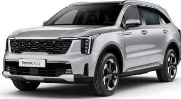
Saten Gri (4SS)