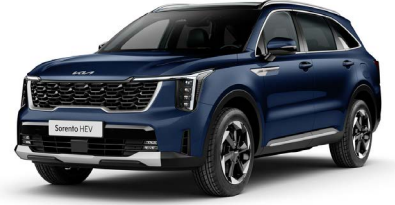
Gravity Mavi (B4U)